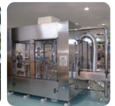
クリーンルーム清浄度クラス10,000 (米連邦規格No.209D、NASA規格)の日本の工場での瓶詰め